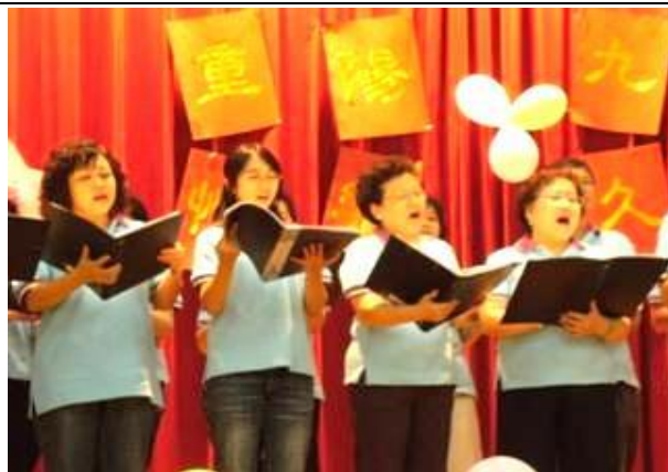
台北市關懷敬老音樂會-台電合唱團