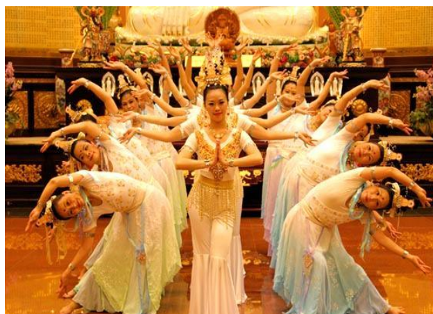
文山區舞蹈表演會-人間敦煌舞蹈團